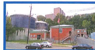
North Bergen MUA Woodcliff Water Treatment Plant