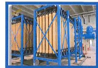
New Membrane Filtration System