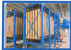
Nuevo Sistema de Filtración de Membrana